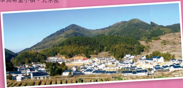
福建古田华润希望小镇

2008年起，华润集团陆续在中国的贫困地区选址建设希望小镇。通过统一规划，就地改造、重建，彻底改变农民的居住环境，同时利用华润集团的产业和资源优势，帮助农民成立专业合作社，把华润希望小镇建设成为一个生态、有机、绿色、和当地自然环境保持和谐一致，具有农业发展活力、鲜明地方特色和民族特色的新农村。至今，华润集团已建成广西百色、河北西柏坡、湖南韶山、海南万宁、福建古田华润希望小镇。北京密云、贵州遵义、安徽金寨华润希望小镇正在规划建设中。未来，华润集团还将中国的贫困地区建设更多的希望小镇。